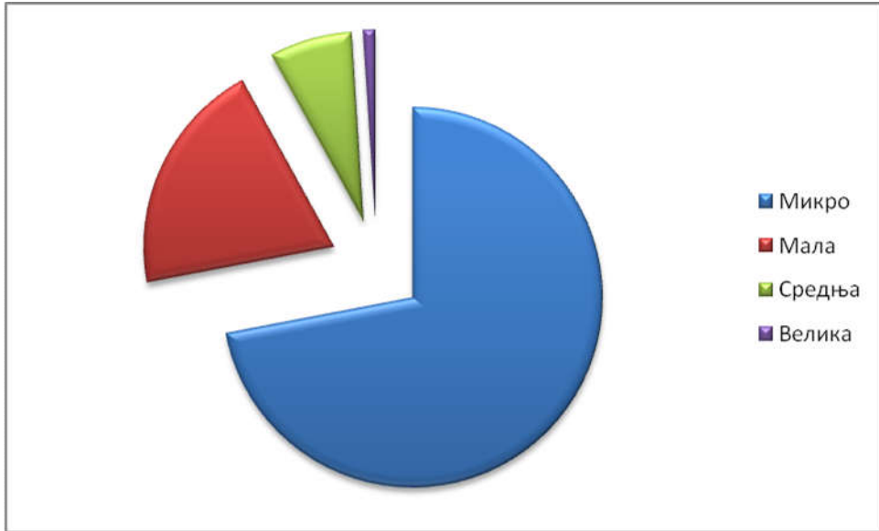
Графикон 2. Предузећа у Бијељини према величини, 2013. година